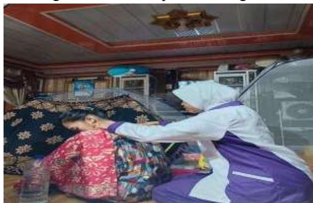
Gambar 3. Pelaksanaan Pijat Laktasi

Berbagai cara dapat dilakukan untuk meningkatkan produksi ASI, pada masa nifas ibu karena penurunan hormon oksitosin termasuk terapi nonfarmakologis seperti penggunaan jamu, akupunktur, imagery, pijat dan penggunaan daun kol. Pijat terapi dapat dilakukan secara sederhana sesuai kebutuhan ibu nifas yaitu pijat oksitosin, pijat punggung, pijat relaksasi oketani dan pijat laktasi karena memiliki manfaat untuk menambah produksi ASI (Katmini dan Sholichah, 2020). Berdasarkan hasil penelitian sebelumnya menunjukkan hasil bahwa ibu nifas yang diberikan pijatan laktasi ASI nya baik (70%) dibandingkan dengan kelompok yang tidak diberikan pijatan laktasi (Julianti & Susanti, 2019). Berdasarkan analisis situasi tersebut maka perlu adanya suatu upaya untuk meningkatkan pengetahuan dan keterampilan ibu untuk mengetahui cara meningkatkan produksi ASI awal menyusui dengan melakukan terapi komplementer pijat laktasi mengingat pentingnya ASI Eksklusif bagi bayi, dan ibu maupun negara ini untuk meningkatkan kualitas penerus bangsa.