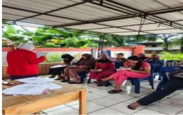
Gambar 2. Penjelasan Materi Pendkes pijat laktasi

Menurut Macmudah 2017, Pijat Laktasi merupakan manajemen keterampilan untuk mengatasi masalah laktasi seperti produksi ASI yang tidak cukup dengan cara meningkatkan hormon prolaktin, serta mengatasi masalah pembengkakan payudara. Pemberian rangsangan pada otot-otot payudara akan membantu merangsang hormone prolaktin untuk membantu produksi air susu sehingga akan meningkatkan produksi ASI ibu pada saat bayi akan menyusui.