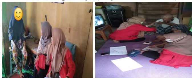
Gambar 3. Pelaksanaan Edukasi Kesehatan

Keberhasilan pelaksanaan kegiatan ini telah sesuai dengan rencana dan harapan yang diinginkan dalam peningkatan kesadaran lansia dan keluarga terhadap kemandirian lansia dalam pemenuhan aktivitas sehari-hari (Endah, 2020). Kemandirian fungsional bermakna mampu dan mau melakukan aktivitas sehari-hari tanpa bantuan orang lain. Aktivitas yang dikategorikan dalam kemandirian fungsional yaitu, mandi, makan, kontinen, berpindah, toileting, dan berpakaian. Tingkat kemandirian dalam melakukan Aktivitas Kehidupan Sehari-hari (AKS) merupakan salah satu faktor yang mempengaruhi kualitas hidup lansia ditambah dengan adanya peran keluarga yang memegang andil yang besar dalam pemberian perawatan lansia sehingga lansia dapat mempertahankan fungsi motorik dan kognitifnya (Alfyanita et al., 2016).