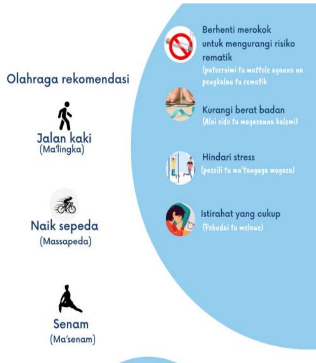
Gambar 2. Poster Pengabdian kepada Masyarakat