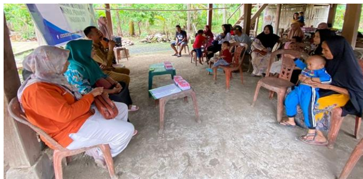
Gambar 2. Pembukaan Oleh Kepala Desa Tottong

Kurangnya pengetahuan ibu tentang gizi seimbang dapat disebabkan oleh berbagai faktor terutama pada ibu yang berada di wilayah desa dengan jarak akses pusat kota yang jauh sehingga akses terbatas terkait Informasi tersebut. Selain itu juga bias karena faktor Budaya dan Tradisi dimana keluarga masih memegang teguh tradisi dan kebiasaan tertentu terkait pola makan yang tidak selalu mencerminkan pengetahuan gizi terkini. Budaya dan tradisi dapat memainkan peran besar dalam kebiasaan makan dan pemahaman tentang gizi. Selanjutnya yaitu kurangnya kesadaran akan pentingnya gizi seimbang dan tidak ada upaya yang cukup untuk memberikan informasi kepada masyarakat. Untuk itu kegiatan Pengabdian yang dikemas dalam bentuk penyuluhan dan edukasi diharapkan dapat membantu meningkatkan kesadaran akan pentingnya pola makan sehat. Dan yang tidak kalah pentingnya yakni Perubahan Gaya Hidup dan Pola Makan Modern: Perubahan gaya hidup, termasuk konsumsi makanan cepat saji dan makanan olahan, dapat berdampak negatif pada pemahaman tentang gizi seimbang. Masyarakat yang cenderung mengonsumsi makanan ini kurang memahami nilai gizi dari makanan tersebut (Nuzrina et al. , 2020).