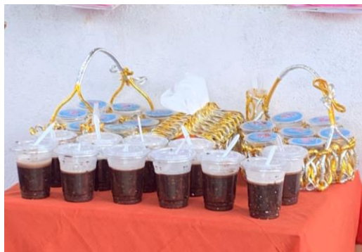
Gambar 3. Contoh Menu MPASI yang dibagikan (Bubur Kacang Hijau dan Ketan Hitam)

Kegiatan Penyuluhan pada gambar 2, yang di hadiri oleh Kepala Desa Tottong didampingi oleh ibu Ketua Tim Penggerak PKK Desa Tottong serta Bidan Penanggungjawab KIA Puskesmas Leworeng dimana diawali dengan sambutan sekaligus dibuka langsung oleh kepala Desa Tottong. Dalam sambutan tersebut kepala Desa memberikan motivasi kepada seluruh warga yang hadir tentang betapa pentingnya mengetahui penyebab serta dampak apa yang akan terjadi terkait kejadian stunting yang dialami di Desa Tottong. Harapan pemerintah Desa dengan adanya kegiatan edukatif ini, dapat memberikan wawasan terhadap warga bgmn cara mencegah Stunting melalui Gizi seimbang dengan memodifikasi menu makanan yang variatif yang ada dilingkungan sekitar.