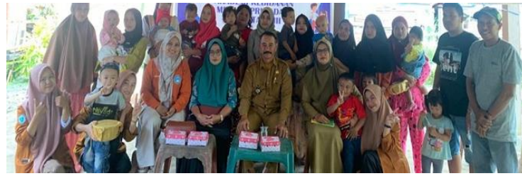
Gambar 4. Dokumentasi Foto Bersama dengan Peserta Penyuluhan