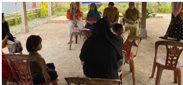
Gambar 3. Sesi Tanya jawab

Kegiatan ini sendiri dilaksanakan dengan memberikan Edukasi langsung kepada seluruh peserta yang diawali dengan membagikan MPASI kepada seluruh peserta yang hadir.