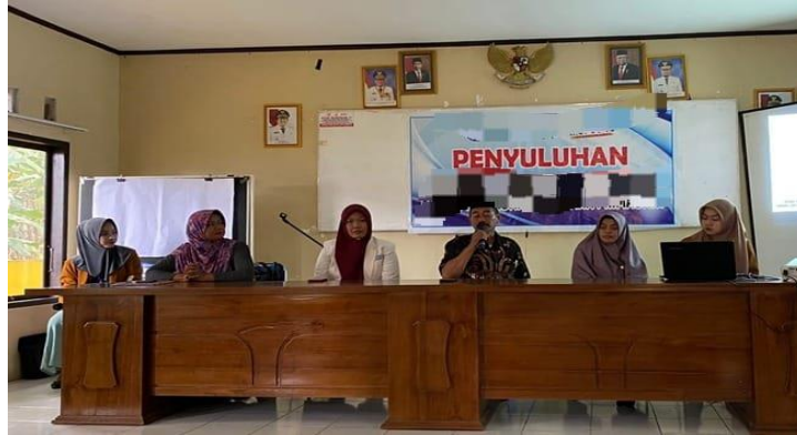
Gambar 2. Sambutan Kepala Desa Tottong

Berdasarkan pendidikan terakhir sebagian besar yaitu 64,1% responden dengan pendidikan SMP dan tidak ada yang tamat perguruan tinggi. Hal ini sesuai dengan hasil penelitian yang menyatakan bahwa ibu hamil yang baik Sebagian besar dengan Pendidikan Sarjana, dengan demikian rendahnya tingkat pendidikan dapat menyebabkan rendahnya pengetahuan dan keterbatasan dalam mendapatkan informasi mengenai cara mencegah stunting pada ibu hamil.