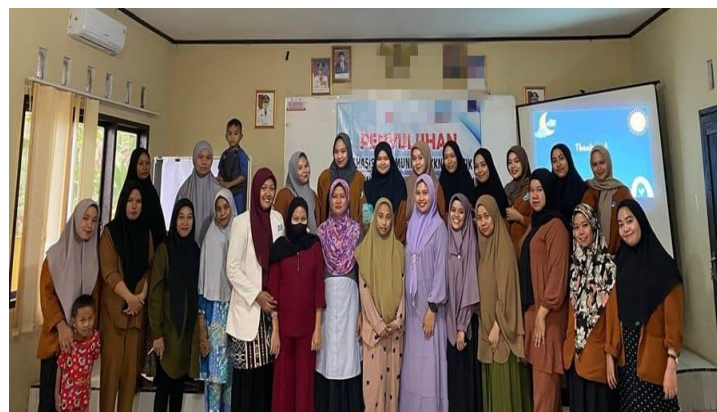
Gambar 3. Foto Bersama

Saat pelaksanaan kegiatan berlangsung yang kurang lebih 3 jam didapatkan respon peserta yang cukup aktif dalam mengikuti penyuluhan tersebut, yang dinilai dari antusias peserta mendengarkan materi dan sebelum penyuluhan dilakukan foto bersama dengan seluruh peserta dan tamu undangan.